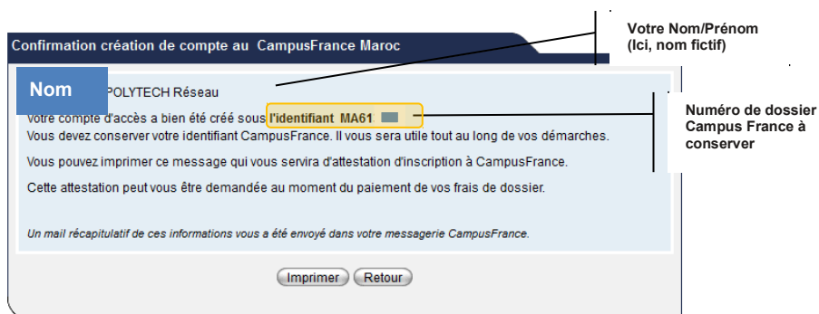
Figure 2 – Confirmation création d'un compte